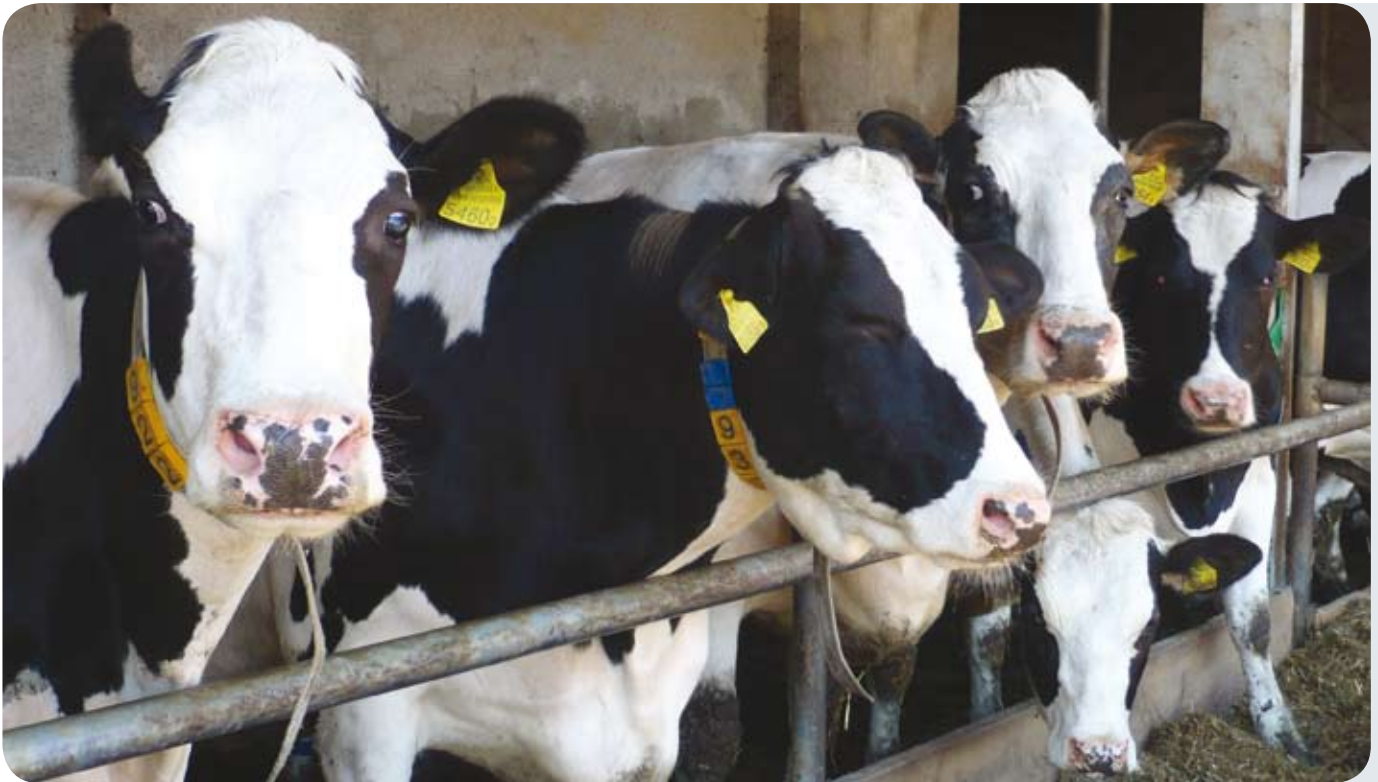
W gospodarstwie Joachima Matejki krowy żywiąone są pełnym TMR – em podawanym na stole paszowym

owników, pozwala na błyskawiczne wykrywanie rui, dzięki czemu zużycie nasienia spadło z 4 do 2. Obniżeniu uległy również koszty weterynaryjne – krowy, w specjalnie wydzielonej porodówce, w większości wypadków rodzą same, bez pomocy ludzi.